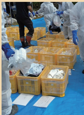
②人の手でごみを細かく分けていきます