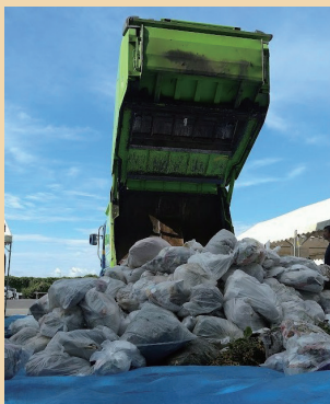
①ごみ収集車から可燃ごみを出します

食べ残しなど、まだ食べられるのに捨てられる食べ物を「食品ロス」と言います。世界では食べ物の3つに1つを捨てていると言われていますが、松山ではどうだろう… 実態を調べてみました!