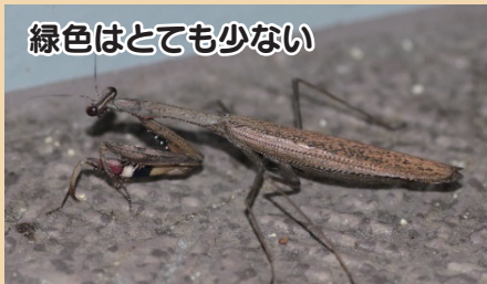
緑色はとても少ない

ハラビロカマキリ (45-71mm) ・前脚に数個の黄色い突起がある ・前翅に白い斑紋がある ・腹部が幅広い ・すむ場所：木の幹や枝葉